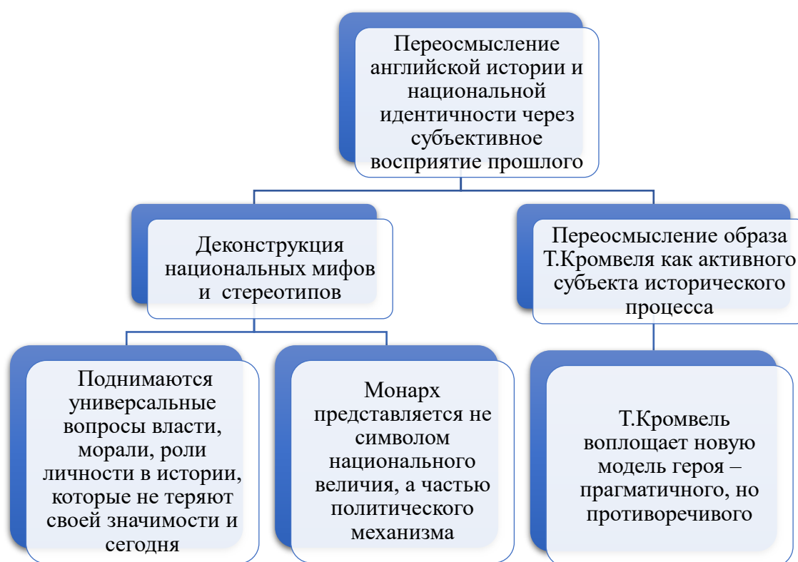
Рисунок 1. Особенности переосмысления английской истории и национальной идентичности в трилогии Хилари Мантел

Обращаясь к эпохе Реформации и правлению Генриха VIII, Х.Мантел деконструирует устоявшиеся мифы и стереотипы, обнажая противоречивую природу национального характера (см. Рис. 1):